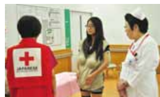
妊婦さんって、こんなに重いんだ!