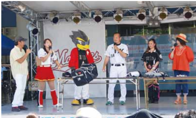
大谷選手にも登場していただいたチャリティーオークション

日本赤十字社千葉県支部は、赤十字サポーターである千葉ロッテマリーンズのご協力のもと、対広島カープ戦にて「赤十字応援デー」を開催しました。