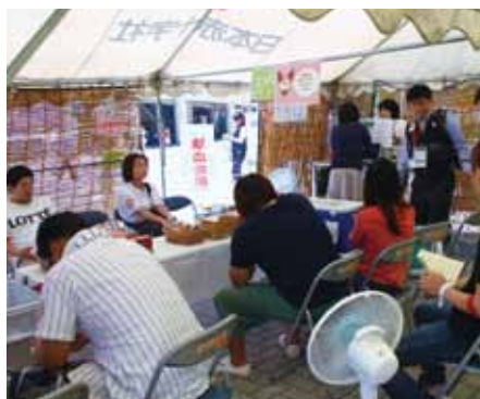
70名以上の方が試合前の献血に足を運んでくれました。