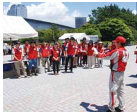
40名以上の奉仕団員も参加