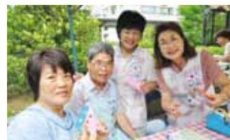
病院ボランティアの方と短冊作り