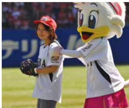
ファーストピッチに当選いざマウンドへ