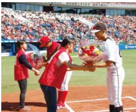
青年赤十字奉仕団員から花束贈呈