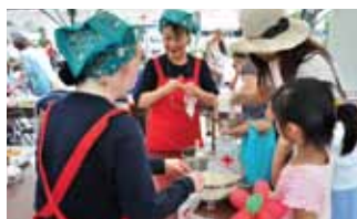
ハイゼックスを使って炊き出し体験

そのほか、健康相談コーナーや妊婦体験のできる「こんにちは赤ちゃん」コーナー、東日本大震災をうけ、避難所で生活をする方の癒しのために実施したハンドケアのコーナーなどを設け、成田赤十字病院の役割や機能を広く地域の皆さまに伝えました。