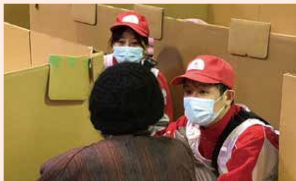
珠洲市内の避難所にて巡回診療を行う 成田赤十字病院の医師・看護師

医療救護班は原則として、医師を班長とする6名(医師1名、看護師3名、主事2名 ※千葉県支部では薬剤師1名を追加した計7名)を1班として編成し、医薬品や医療資機材のみならず、班員の水、食料、寝具等も持参し、自己完結型の医療救護活動を展開する医療チームです。