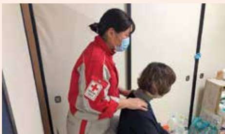
被災者だけでなく支援者の支援として被災した自治体職員の手や肩をもみ、こころのケアを行う成田赤十字病院の看護師

研修により必要な知識や技術を身に付けたこころのケア要員が、避難所や地域を巡回しながら被災者の方々と接する中で、健康や身近な悩みなどをお聞きし、力になれるように心理社会的支援を行います。必要に応じて、専門的な支援への橋渡しを行うことも重要な役割となります。