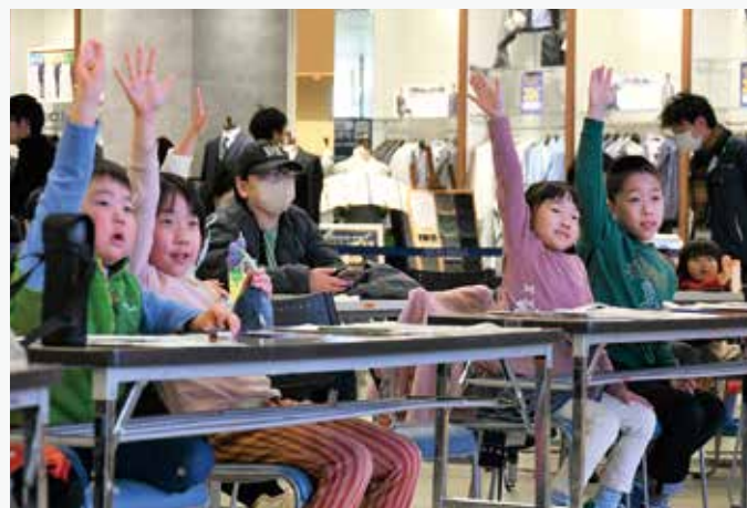
防災クイズに積極的に参加してくれた子どもたち

千葉県で地震が続いていることもあり、クイズやゲームを楽しみつつも、真剣な表情で参加するご家族が多かったです。