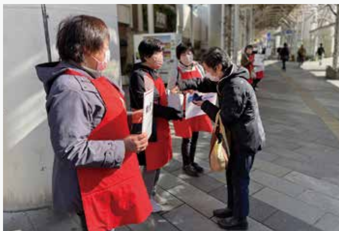
奉仕団が一丸となって行った街頭募金

募金にご協力いただいた皆様、誠にありがとうございました。お預かりした義援金は、全額を義援金配分委員会へお送りし、市町村等の自治体を通じて、被災地の方々の生活支援に役立たせていただきます。