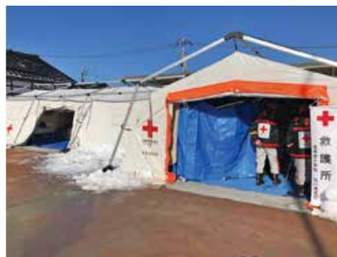
医療救護班が活動したすずなり救護所

※被災地での救護活動が継続的かつ絶え間なく行えるよう、全国の赤十字医療救護班の支援体制を計画的に構築し、被災地に派遣しています。