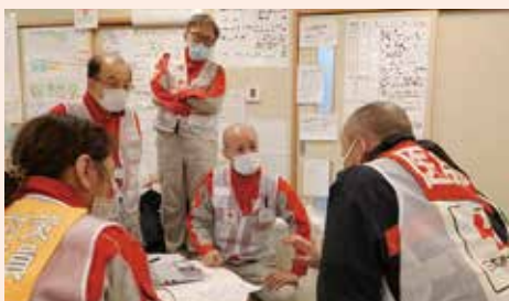
救護班から活動報告を受ける コーディネートチーム

被災地の保健医療ニーズを把握し、都道府県保健医療調整本部の災害医療コーディネーター等との協議・調整を行うとともに、救護班の活動に関して医療救護の専門的観点から活動の調整等を行います。(基本構成:医師、看護師、薬剤師、事務職員等の計4人)