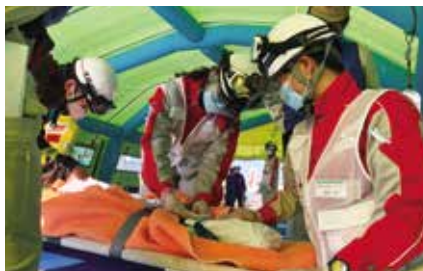
感染症流行下においても災害救護活動を実施します。

日本赤十字社は、苦しんでいる人を救いたいという思いを結集し、人のいのちと健康、尊厳を守ることを使命として、世界192か国に組織された赤十字・赤新月社と連携し、国内外において様々な人道的活動を展開しています。