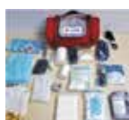
緊急セット 1セット3千円