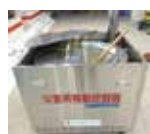
災害用移動炊飯器 1基30万円