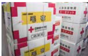
パック加工された毛布