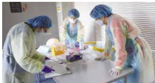
新型コロナウイルス等の感染症流行時にも医療救護班を派遣します。