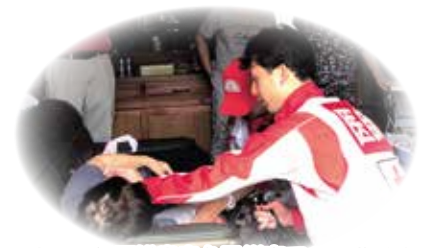
令和元年房総半島台風災害での救護活動

日本赤十字社では、災害発生時に医療救護をはじめさまざまな形で被災者に寄り添う支援を行っております。