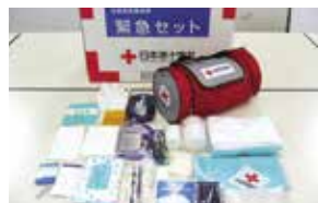
マスク、ウエットティッシュ、ラジオ、懐中電灯、歯ブラシなどを収納