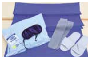
キャンピングマット、枕、アイマスク、耳栓、スリッパ、靴下などを収納