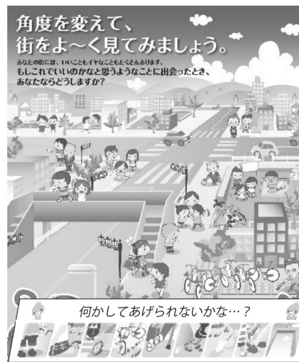
下部を折り返すと、モグラの「キヅキくん」が見つけたヒントが現れます。